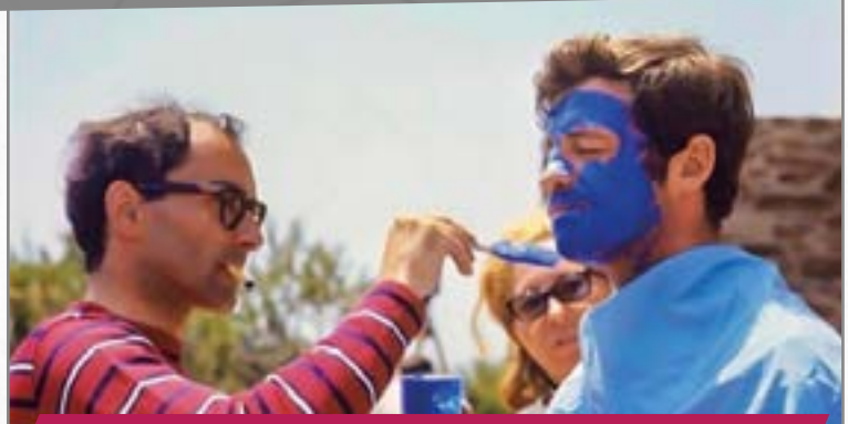
Le cinéma suisse à l'honneur avec « Pierrot le fou » de Jean-Luc Godard.

Le festival du cinéma francophone revient du 14 au 22 mars à Villers-Cotterêts pour sa cinquième édition. La Suisse et son célèbre réalisateur franco-suisse Jean-Luc Godard sont à l'honneur cette année.