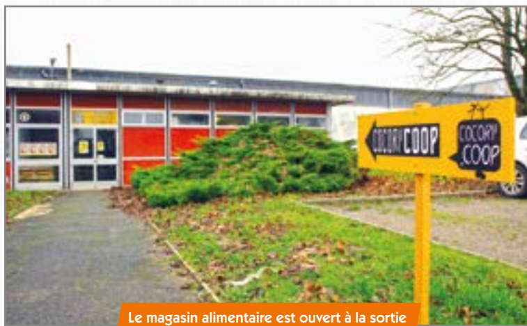
Le magasin alimentaire est ouvert à la sortie de Villers-Cotterêts, direction La Ferté-Milon.

Les horaires d'ouverture sont, pour le moment, le mercredi de 18h30 à 19h30 et le samedi de 10h à 12h et de 15h à 18h, et l'accent est