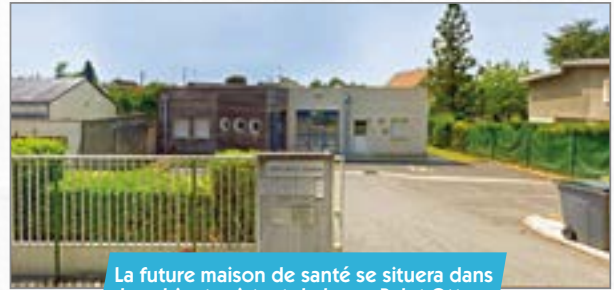
La future maison de santé se situera dans le cabinet existant de la rue Pelet Otto.

La CCRV a en effet planché sur les façons de lutter contre les déserts médicaux. C'est dans cette démarche que le projet de création d'une maison de santé pluri-professionnelle s'est inscrit, et s'est même construit plus précisément autour d'un cabinet existant, celui des docteurs Delbende-Caron, rue Pelet Otto.