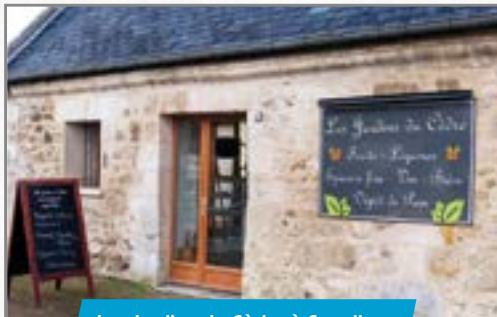
Les Jardins du Cèdre à Coyolles.

• Les Jardins du Cèdre, l'épicerie de produits locaux et bio, qui a fermé au 13 place du Docteur Mouffier à Villers-Cotterêts suite à l'effondrement du plancher, a ouvert mi-février rue du Vieux Château à Coyolles. L'activité est toujours présente sur les marchés.