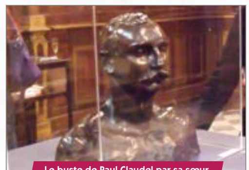
Le buste de Paul Claudel par sa sœur Camille, exposé à Soissons en 2010.