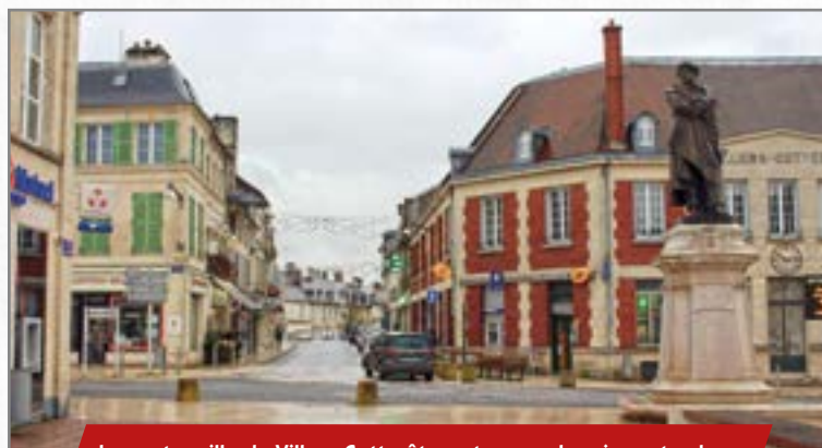
Le centre-ville de Villers-Cotterêts en travaux depuis septembre.

Une deuxième réunion est cependant programmée en ce mois de mars pour traiter les demandes qui n'ont pu être prises en compte en février. Elle permettra de clôturer ainsi les indemnisations liées aux travaux d'assainissement menés par la CCRV (1 ère phase).