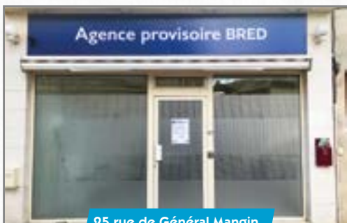
25 rue de Général Mangin.

• L'agence bancaire Bred, située au 3 place du Docteur Mouffier à Villers-Cotterêts, a transféré provisoirement ses locaux le temps des travaux, au 25 rue du Général Mangin.