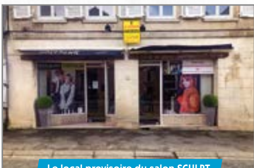
Le local provisoire du salon SCUPLT au 35 rue Demoustier.

• 13 place du Docteur Mouffier à Villers-Cotterêts, le plancher des Jardins du Cèdre s'était effondré. Des poutres communes ont contraint le commerce voisin, le salon de coiffure SCUPLT, à déménager par précaution au 35 rue Demoustier depuis juillet dernier. Provisoirement, car le local vient d'être vendu, et le salon va donc devoir trouver un autre emplacement prochainement.