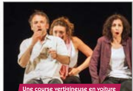
Une course vertigineuse en voiture pendant Le porteur d'histoire.

Le Porteur d'histoire, salle Demoustier à Villers-Cotterêts, 30 mai à 20h30.