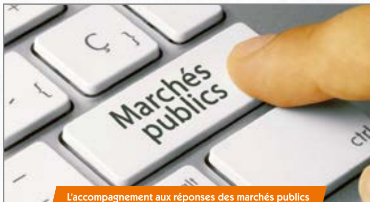
L'accompagnement aux réponses des marchés publics est l'une des missions de la convention.