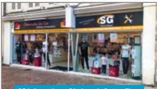
SG Informatique, 24 place du Dr Mouffier.

• 24 place du Docteur Mouffier à Villers-Cotterêts, SG Informatique (anciennement située au 29 rue du Général Mangin et créée en avril 2015) s'y est installé depuis la mi-février. L'activité de maintenance informatique est dorénavant complétée par une offre de personnalisation d'objets.