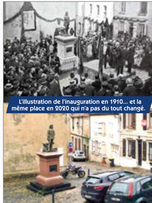
L'illustration de l'inauguration en 1910... et la même place en 2020 qui n'a pas du tout changé.

Mais l'hommage à l'enfant du pays est rendu depuis bien longtemps, comme en témoigne cette archive issue des collections du musée Racine de La Ferté-Milon : l'article de presse retraçant l'inauguration de la statue de Racine enfant en 1910. L'auteur rappelle que la statue en bronze représente le dramaturge vers l'âge de quatorze ans, et qu'elle est « l'œuvre du regretté sculpteur Hiolin, mort il y a quelques mois », et qui n'aura donc pas pu assister à sa présentation à la population. Depuis 110 ans, son œuvre a cependant traversé les générations et elle restera un point central de l'identité des Milonais.